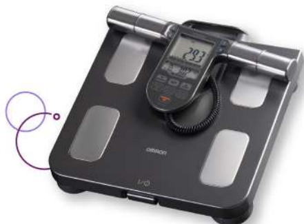
Balanza control peso Omron HBF514C x 1 ud. Plu: 1418680 Unidades: 20