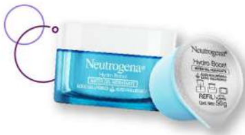
Gel hidratante Neutrogena Hydro Boost x 50 g Plu: 1449157 Unidades: 35