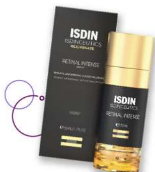
Serúm facial ISDIN Isdinceutics Retinal Intense x 50 ml Plu: 1449251 Unidades: 20