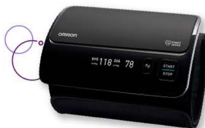
Tensiometro digital Omron de brazo Evolv-7600 x 1 ud. Plu: 1418688 Unidades: 20