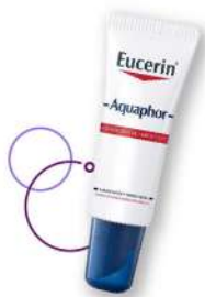
Reparador de labios Eucerin Aquaphor x 10 ml Plu: 1450710 Unidades: 35