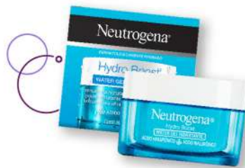
Crema hidratante Neutrogena Hydro Boost x 50 g Plu: 1313712 Unidades: 35