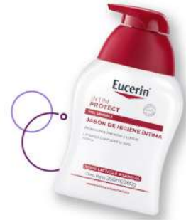
Jabón de higiene íntima Eucerin x 250 ml Plu: 813038 Unidades: 35