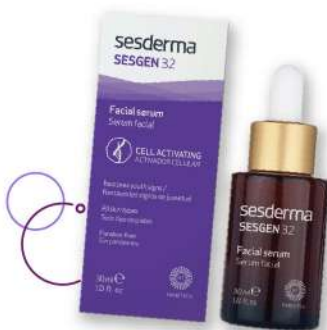
Serúm facial Sesderma Sesgen 32 x 30 ml Plu: 1419934 Unidades: 20