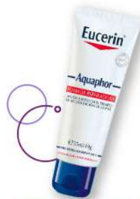
Pomada reparadora Eucerin piel extremadamente seca x 49 g Plu: 1341543 Unidades: 35