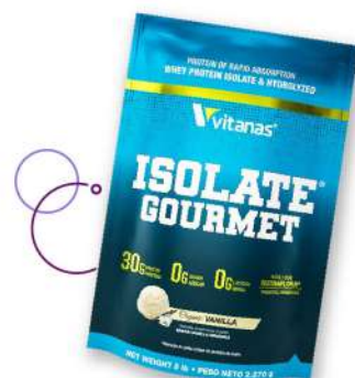
Proteína Isolate Gourmet Vitanas sabor a vainilla x 2.270 g Plu: 1241960 Unidades: 20