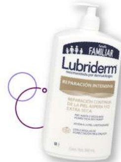
Crema Lubriderm reparación intensa x 946 ml Plu: 1368494 Unidades: 35